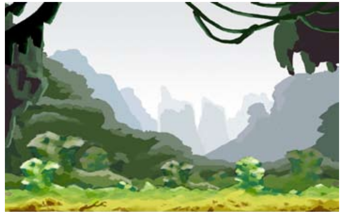
Eksempel med digitale farver

Her har jeg prøvet at lave dybde i billedet vha. farver, uden at bruge former og liner.