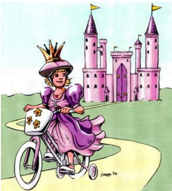
Eksempel med 2 tusch tegninger og marker farver.

Tegningen af juletræets har mindre kontrast og mere realistiske farver, hvilket ikke klæder et julekort. Yderligere er baggrunden for mørk, der skulle højest være en meget lys blågrå som baggrund.