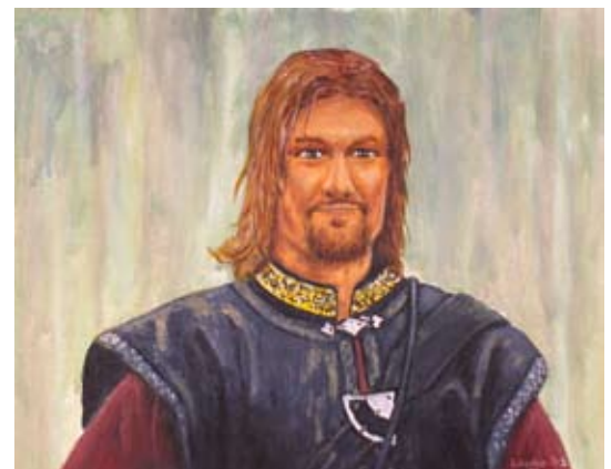
Eksempel med akryl på lærred og digital ændring

Det er selvfølgelig en balance, hvis man gør baggrunden for grå vil forgrund og baggrund ikke virke som en helhed.