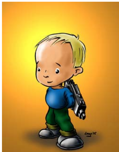
Eksempel med tusch og digitale farver

Her er baggrunden meget farvemættet og forsøger dominere, men figuren har så klar kontrast og mørke farver at det lykkes for den at komme i forgrunden. Så det kan godt lykkes at bryde nogle af reglerne.