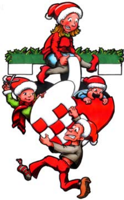
Eksempel med 2 tusch tegner med digitale farvelægning.