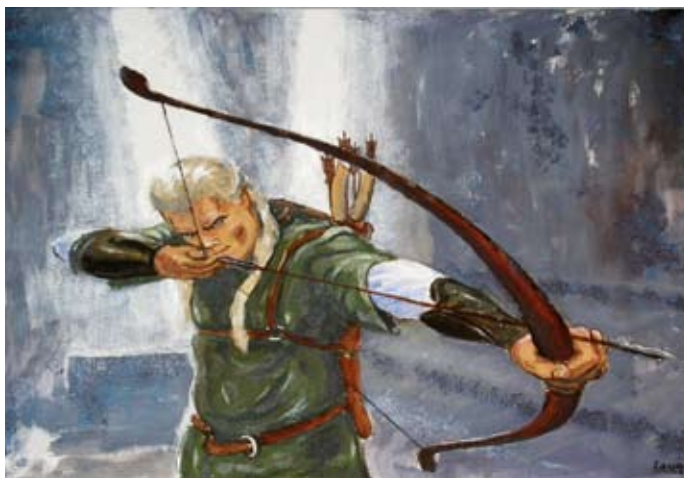
Eksempler med akryl på lærred.

Ved at blande en farve med sin komplementær farve, kan man knække den og får mere dæmpede og troværdige farver.